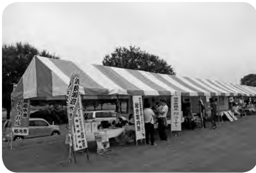
▲渡良瀬遊水地 フェスティバル2013