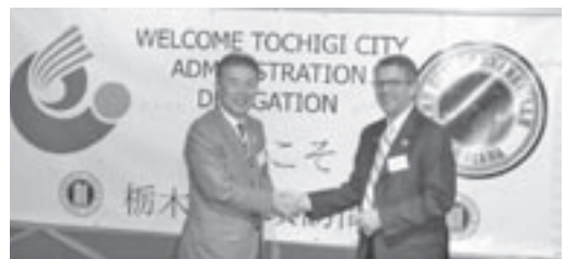
エバンズビル市 ウィニキー市長と握手