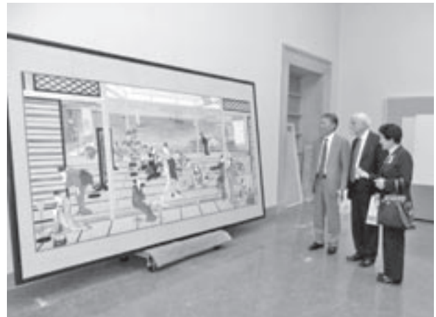
「月」の作品説明を受ける市長等