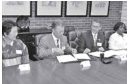
姉妹都市提携の確認決議書にサイン