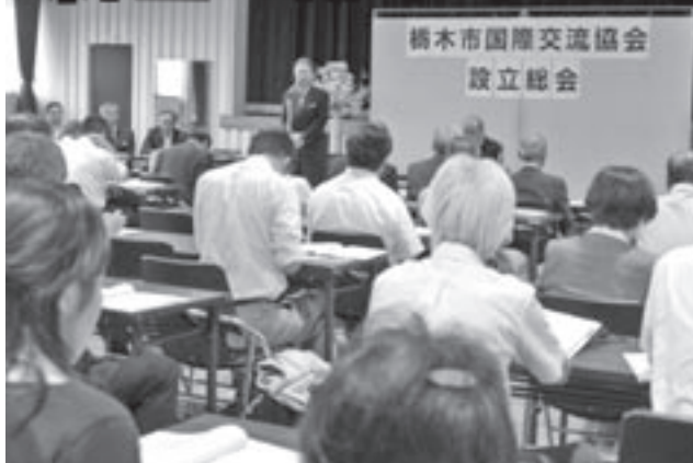
平成24年度栃木市国際交流協会役員名簿